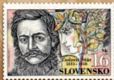
Ludovít Štúr 3. miesto rok 1995