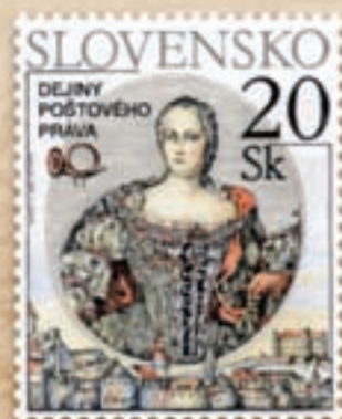
Dejiny poštového práva 1. miesto rok 2000