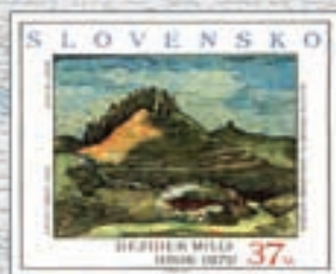
UMENIE - DEZIDER MILLY