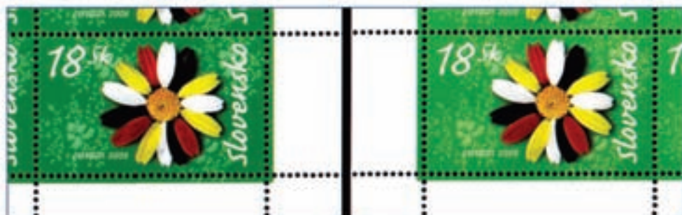
V emisií Európa sú známe dve farebné mutácie (tmavo-, a svetlozelená) viditeľné pri dennom svetle .

2006, 5. 5. * Imigranti očami mladých ľudí (Europa) * príležitostná známka * N: M. Mistrík * OF+RT Álami Nyomda, Maďarsko * PL: 10 ZP, TF: ? PL * papier -oz- * HZ 13 3 / 4 ; 13 * FDC N: M. Mistrík, NP: J. Piačková, OF TAB * náklad 500 tis.