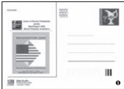
Zväz slovenských filatelistov, sekretariát, Radlinského 9, 812 11 Bratislava 1

Stredisko novinkovej služby ZSF ponúka členom ZSF nepredané zásoby známok (čisté i pečiatkované) a výrobkov SP a.s. POFIS (FDC, ZZ, CM, nálepne listy) za nominálne ceny. Zoznam zašleme na požiadanie.