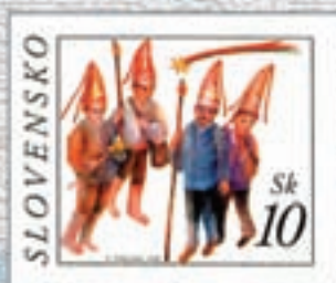
VIANOCE - KOLEDNÍCI