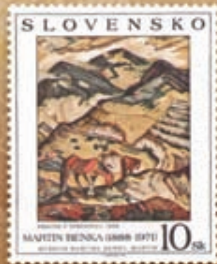
Martin Benka: Krajina z Terchovej 3. miesto rok 1998