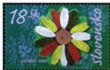
Kresba v lupenoch kvetu je viditeľná len v UV svetle

2006, 5. 5. * Imigranti očami mladých ľudí (Europa) * príležitostná známka * N: M. Mistrík * OF+RT Álami Nyomda, Maďarsko * PL: 10 ZP, TF: ? PL * papier -oz- * HZ 13 3 / 4 ; 13 * FDC N: M. Mistrík, NP: J. Piačková, OF TAB * náklad 500 tis.