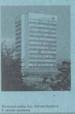
Slovenská pošta, š.p., Banská Bystrica 5. výročie založenia