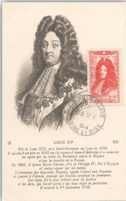
Kráľ Ľudovít XIV.