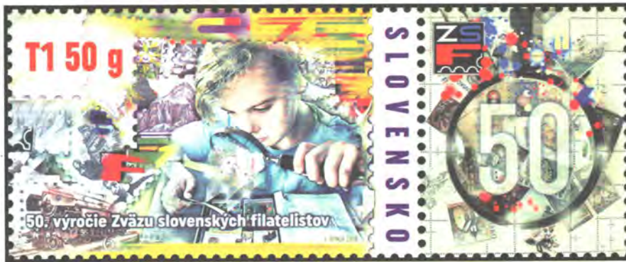
K polstoročnici Zväzu slovenských filatelistov. Autorom dynamického výtvarného návrhu je akad. mal. Igor Benca

časti známky je umiestnená cisárska koruna, po jej stranách čítame nápis „K-K POST STEMPEL“, v spodnej časti hodnotové údaje (v grajciaroch „Kreuzer“). Prví zberatelia známok neboli organizovaní. Spolky,