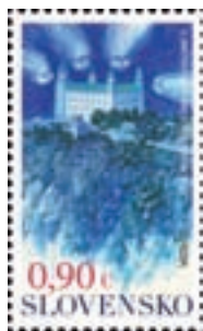
A. Brunovský (1935-1997): ilustrácia z „Modrej knihy rozprávok“