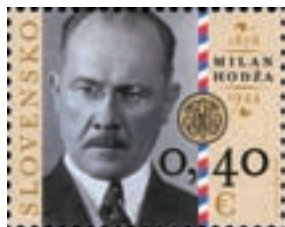
Milan Hodža (1878 – 1944) - politik